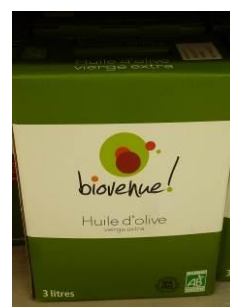
Fontaine à huile ou Bib (3 litres)