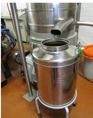
Moulin Terre de Mistral