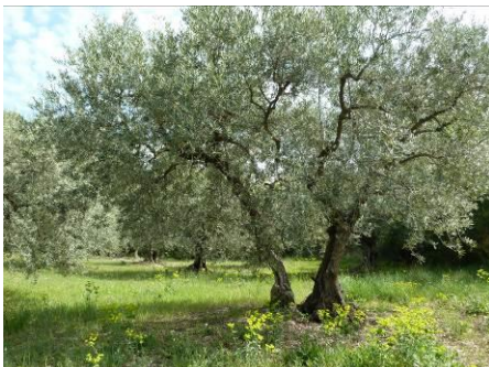
Oliveraie – Moulin du Luberon (Volx)