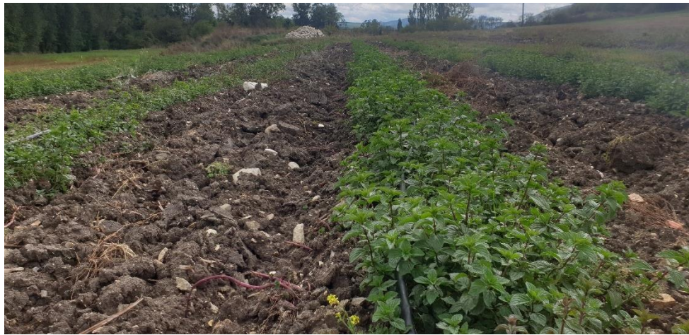
Figure 15 : menthe poivrée en première année après 1 coupe mi août pour distillation (28 sept.)