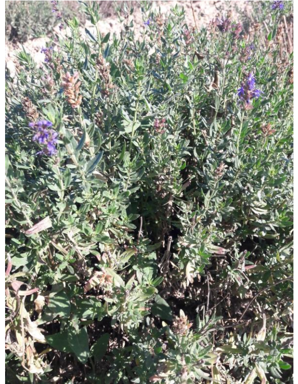
Figure 2 : reprise de l'hysope après la coupe dans le secteur Durance (21 sept.)

04 - Bas de la Vallée de l'Asse/vallée de la Durance : Suite à la coupe, belle reprise de l'hysope, homogène. Les nouvelles feuilles apparaissent.