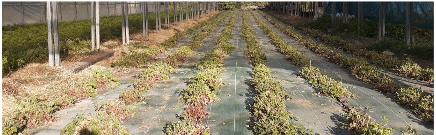
Figure 13 : géranium rosat (3 e année) sous tunnel après récolte (27 sept.)

05 - Gapençais : Très bonne récolte : 572 kg en frais. Parcelle rentable : peu de travail de désherbage, les plants sont beaux, bonne reprise post-récolte.