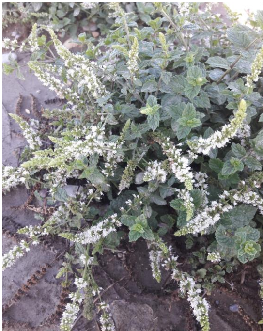
Figure 16 : menthe douce en première année (21 sept.)