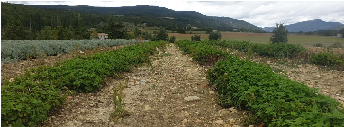
Figure 11 : mélisse (2 ème année) après coupe, sans irrigation (28 sept.)

84 – Albion (secteur Sault) : Mélisse 2 ème année. Une seule coupe effectuée pour la distillation, et pas d'arrosage ensuite (restrictions). Obtention d'hydrolat et quelques traces d'HE.