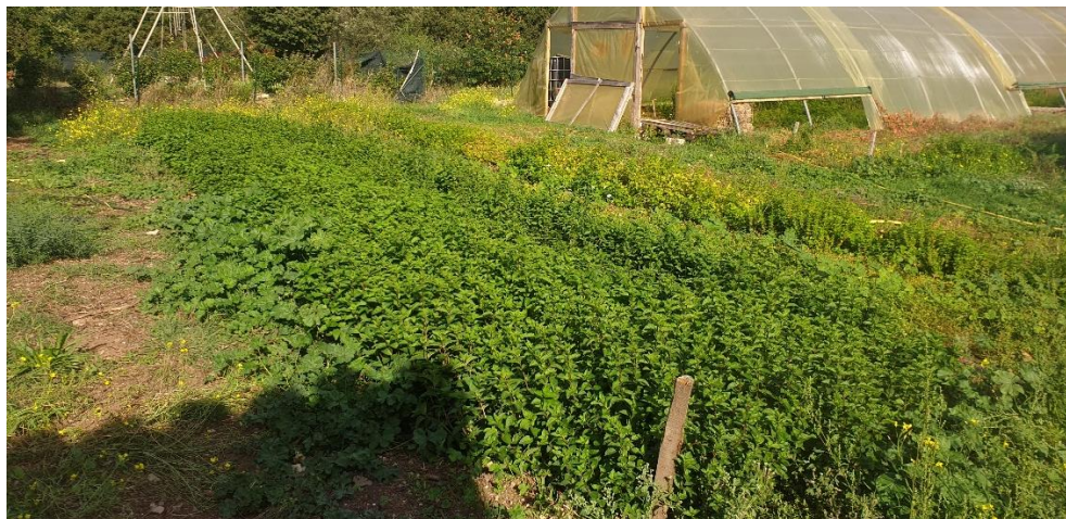
Figure 14 : menthe poivrée en première année avant 4 ème coupe (27 sept.)

84 - Comtat-Venaissin : Plantation de l'année toujours très jolie (plantée très dense, irriguée à goutte-à-goutte), 4 ème coupe prévue début octobre pour la distillation (hydrolat). Gros désherbage manuel au moment de la 1 ère coupe qui a fait prendre largement le dessus à la menthe sur les adventices ensuite. Presque plus de désherbage depuis avant l'été.