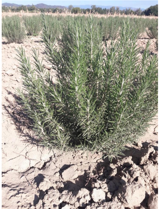
Figure 6 : romarin Sudbury (année de plantation) en basse vallée de Durance (21 sept.)

84 - Albion (secteur Sault) : Romarin cinéole (1 ère année) récolté mi-septembre. Romarin verbénone finalement pas coupé car le risque de gel est déjà présent (il est sensible), donc sera coupé au printemps.