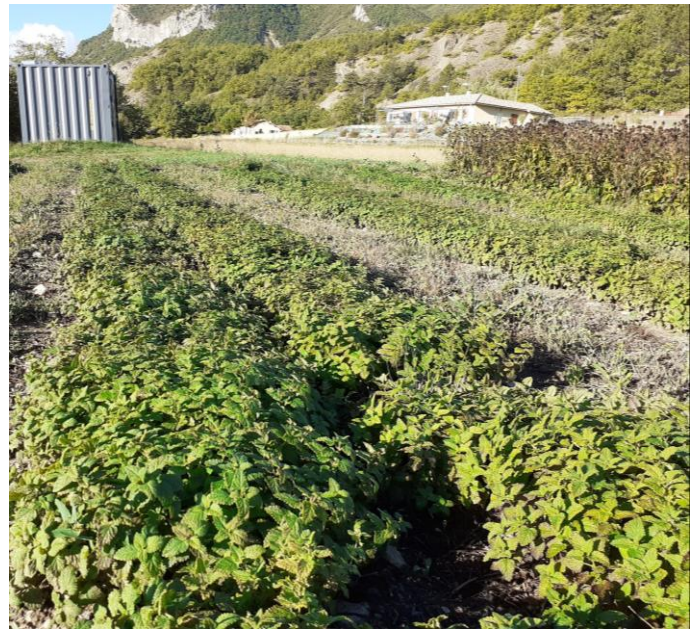
Figure 8 : mélisse après 2 coupes et un manque d'eau - pour l'HE à gauche, pour l'herboristerie à droite - (27 sept.)

05 - Vallée du Buech : Magnifique, très belle reprise. Bientôt la 3ème coupe (début octobre), la plus facile grâce à la forme en boule des lignes.