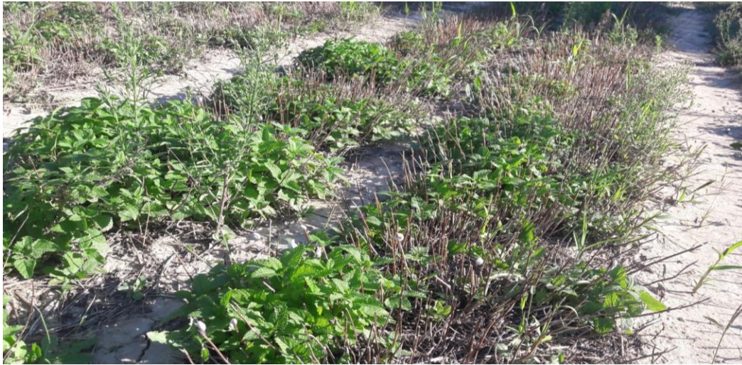
Figure 10 : mélisse après récolte (21 sept.)

84 – Albion (secteur Sault) : Mélisse 2 ème année. Une seule coupe effectuée pour la distillation, et pas d'arrosage ensuite (restrictions). Obtention d'hydrolat et quelques traces d'HE.