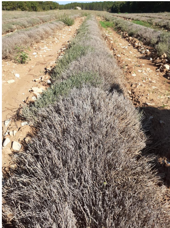
Figure 5 : thym thujanol (4 ans) très touché par l'altise cet été (21 sept.)