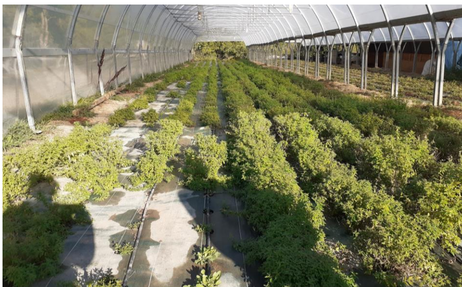
Figure 18 : verveine 3ème année, après 3 coupes à gauche / 2 coupes à droite (27 sept.)

05 – Gapençais (sous serre) : De bonnes récoltes : 62 kg frais en première coupe, 173 kg frais en 2ème coupe, 50 kg frais en 3ème coupe sur la moitié de la parcelle. L'autre moitié doit encore être récoltée selon le besoin en plante sèche (seulement les tiges bien reparties).