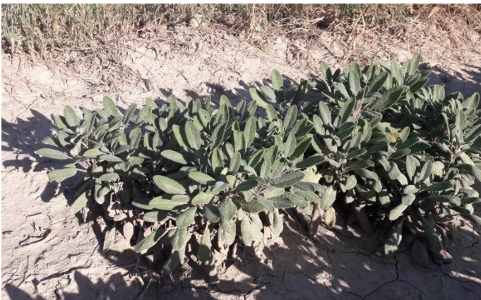
Figure 3 : sauge off. en première année (21 sept.)

04 - Bas de la Vallée de l'Asse/vallée de la Durance : Sauge officinale petite feuille en 1 ère année. Une coupe a eu lieu dans le courant de l'été. Bonne reprise avec une belle densité de feuilles.