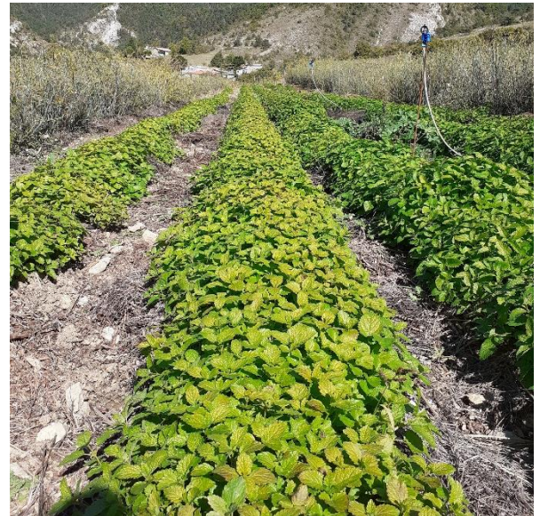
Figure 9 : mélisse de 1, 2 et 3 ans après 2 coupes, en attente de la 3ème coupe (21 sept.)

05 - Vallée du Buech : Magnifique, très belle reprise. Bientôt la 3ème coupe (début octobre), la plus facile grâce à la forme en boule des lignes.