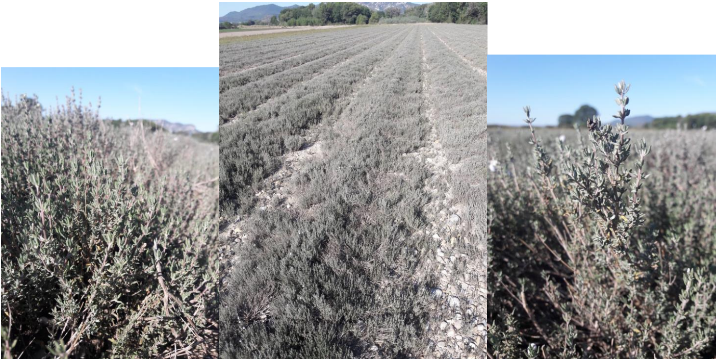
Figure 4 : reprise du thym (herboristerie) après une coupe estivale (21 sept.)

04 - Bas de la Vallée de l'Asse/vallée de la Durance : thym herboristerie. Reprise correcte suite à la récolte de juin, mais pas suffisamment pour faire une 2ème coupe. Le producteur envisage de faire un apport de 50 U d'engrais organique à l'automne pour permettre en redémarrage rapide au printemps, afin de faire une coupe précoce.