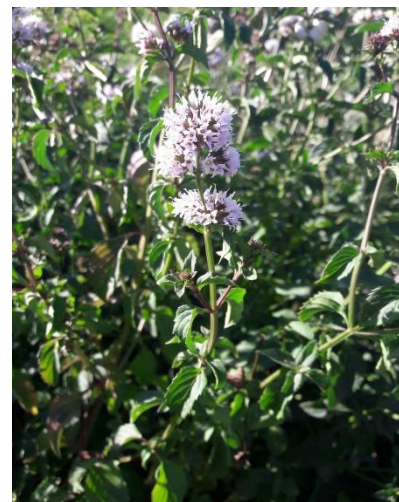
Figure 17 : menthe bergamote en première année (21 sept.)

04 - Bas de la Vallée de l'Asse/vallée de la Durance : En pleine floraison. Jolie, voir ce que les rendements en HE disent mais pas sûr de pouvoir récolter.