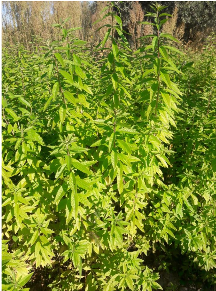
Figure 19 : verveine (21 sept.)

84 – Comtat-Venaissin (sous serre) : bientôt la 4 ème coupe (distillation pour hydrolat) mais pas très jolie (un peu de pucerons et des acariens). Le producteur fera en 2023 une plantation en plein champs.