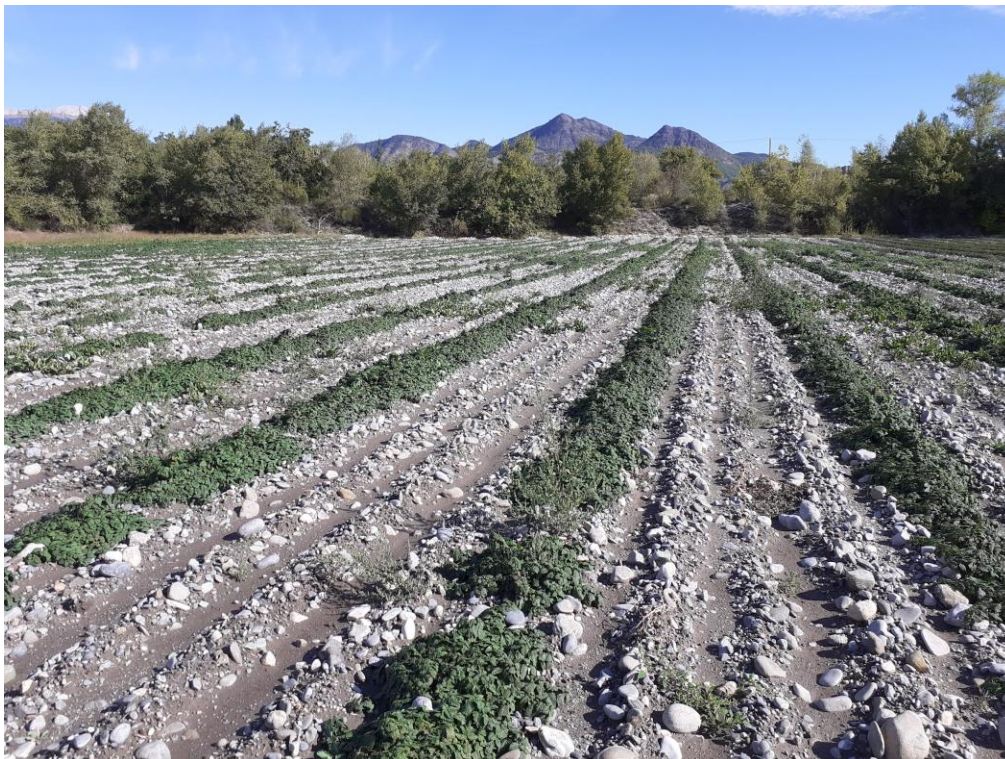
Figure 7 : mélisse pour HE en année de plantation (27 sept.)

05 – Gapençais : Pas de récolte pour cette première année d'implantation. Parcelle en bon état, quelques manques à combler l'année prochaine. Il faudra épierrer le rang et bien adapter la récolteuse pour redresser les tiges rampantes.