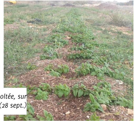
Figure 12 : mélisse en première année, pas récoltée, sur paillage (28 sept.)

84 – Albion : Mélisse en 1 ère année qui se maintient (presque pas irriguée de l'année, plantée sur paillage de broyat de genévrier distillé qui a laissé passer le peu d'eau qu'il y a eu, contrairement à la paille). Elle ne sera pas rabattue avant l'hiver, 1 ère récolte prévue au printemps prochain.