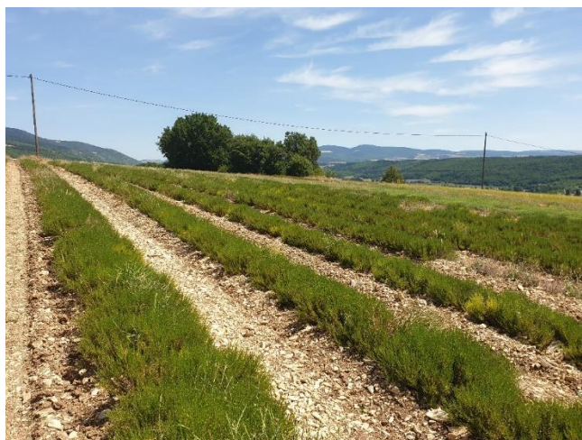
Figure 4: Romarin verbénone qui se développe mal dans le 84

84 – Albion / Comtat-Venaissin : Le romarin verbénone stagne et se développe mal dans tous les secteurs, les feuilles se recroquevillent ce qui est probablement lié au gel de printemps.