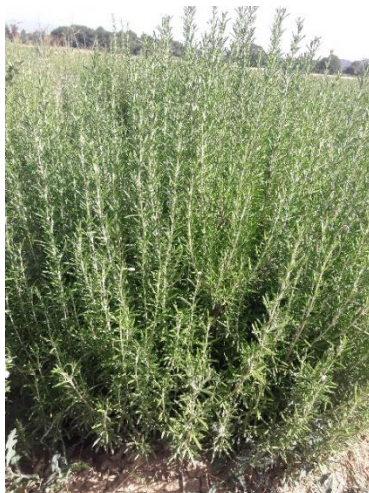
Figure 3 : Romarin en plein développement dans le 04

84 – Albion / Comtat-Venaissin : Le romarin verbénone stagne et se développe mal dans tous les secteurs, les feuilles se recroquevillent ce qui est probablement lié au gel de printemps.