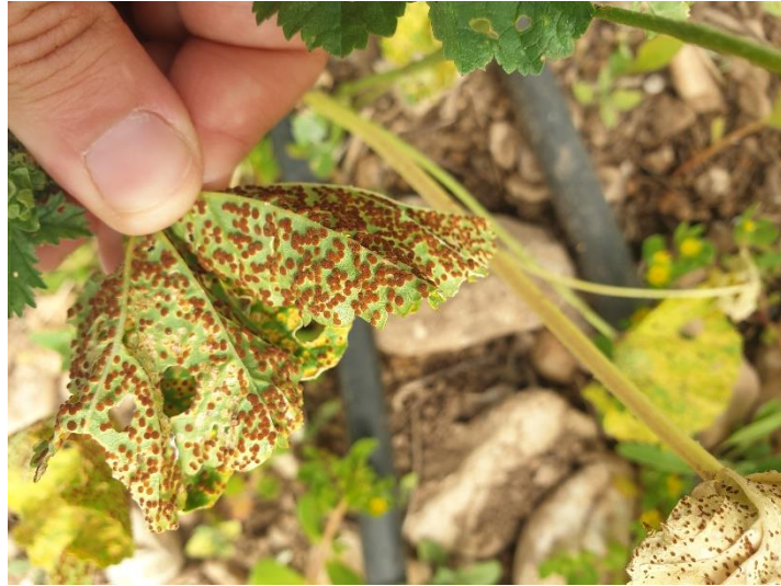
Figure 6 : Rouille sur mauve dans le Vaucluse