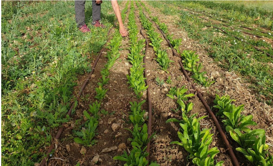
Figure 5 : Semis de calendula du printemps sur Albion