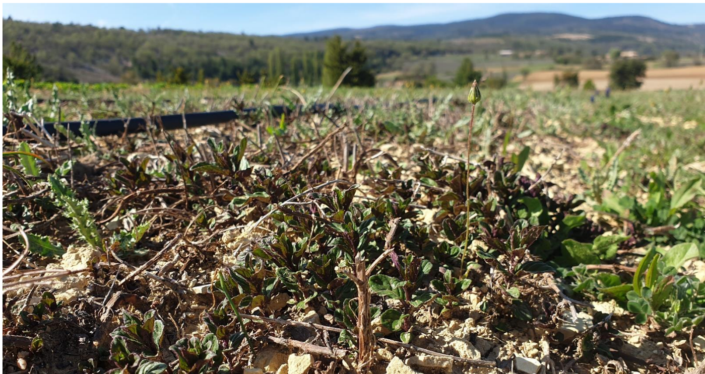
Figure 12 : menthe poivrée qui redemarre, Sault (27 avril)

Les conseillers s'efforcent de communiquer leurs conseils avec le plus grand soin et selon les connaissances actuelles, mais sans engagement de leur part. Avant toute application de produits phytopharmaceutiques se référer à l'étiquette et respecter les bonnes pratiques, notamment le port des EPI ( http://draaf.paca.agriculture.gouv.fr/Le-Guide-phytosanitaire ). Site à consulter pour vérifier les homologations : http://ephy.anses.fr .