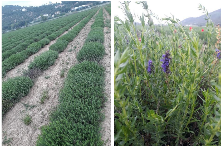
Figure 7 : hysope en val de Durance (3 mai)

84 – Comtat-Venaissin : belle reprise de l'hysope, qui fait quelques fleurs également.