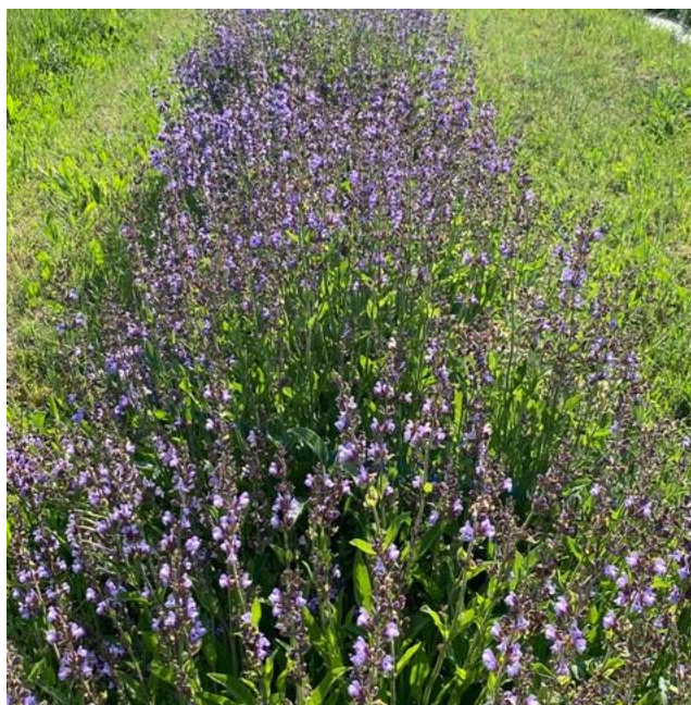
Figure 2 : sauge officinale en floraison, au Thor (10 mai)

84 – Comtat-Venaissin (sol limoneux) : sauge officinale en pleine floraison au 10 mai, bientôt prête à distiller.