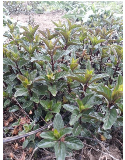
Figure 11 : menthe poivrée en val de Durance (3 mai)

84 – Albion : dans le secteur de Sault, repart mais fait à peine 10 cm fin avril.