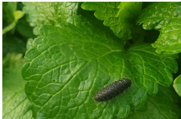
Figure 9 : adulte d'arima (à gauche) et larve (à droite)

Rédaction : Mégane VECHAMBRE – Agribio04, Victor GALLAND – Agribio05, Sarah PARENT – Chambre d'Agriculture 04