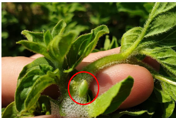
Figure 3 : crachat de coucou sur origan (la cicadelle est au milieu du crachat, souvent sous les feuilles) (3 mai)

84 – Comtat-Venaissin (sol limoneux) : observation de « crachats de coucou » (cercopie des près ou philène spumeuse) sur origan. Peut piquer et provoquer des dégâts (coupe la tête de l’inflorescence, jaunit...), mais pas observé ici pour l’instant.