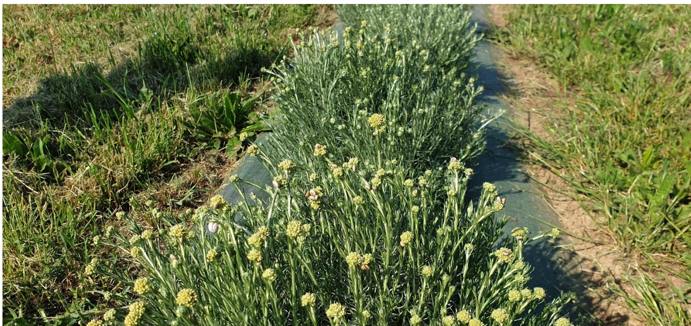
Figure 1 : hélichryses (sur toile tissée) en boutons, Thor (3 mai)

84 – Comtat-Venaissin (sol limoneux) : les hélichryses sont bien en bouton (Thor).