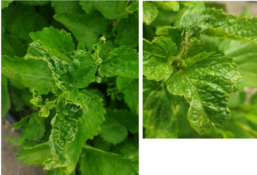
Figure 10 : boursouflures a priori causées par les arimas (+ feuilles mangées)