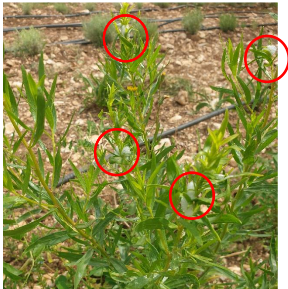
Figure 4 : crachats de coucou sur estragon, à Pernes (3 mai)

84 – Comtat-Venaissin : observation de « crachats de coucou » (cercope des près ou philène spumeuse) sur estragon.