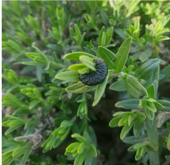
Figure 8 : larves d'arimas sur hysope, La Rochegiron (27 avril)