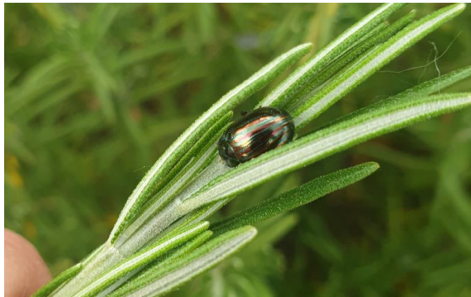
Figure 6 : chrysomèle américaine sur romarin, Pernes (3 mai)

84 – Comtat-Venaissin : observation de chrysomèles américaines (assez peu) ; attention, elle mange les extrémités des tiges de romarin (peut-être aussi présente sur lavande, et potentiellement sur thym et mélisse), et donc les coupe. Peut poser vraiment problème si elle est présente en forte densité (pas le cas ici).