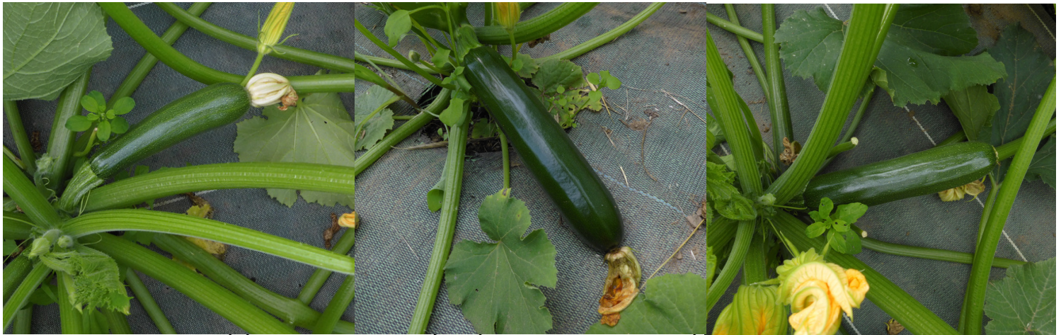
5 juin 2023 - de gauche à droite : zuboda - caravaggio - black beauty