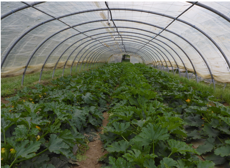
5 juin 2023 : parcelle de l'essai