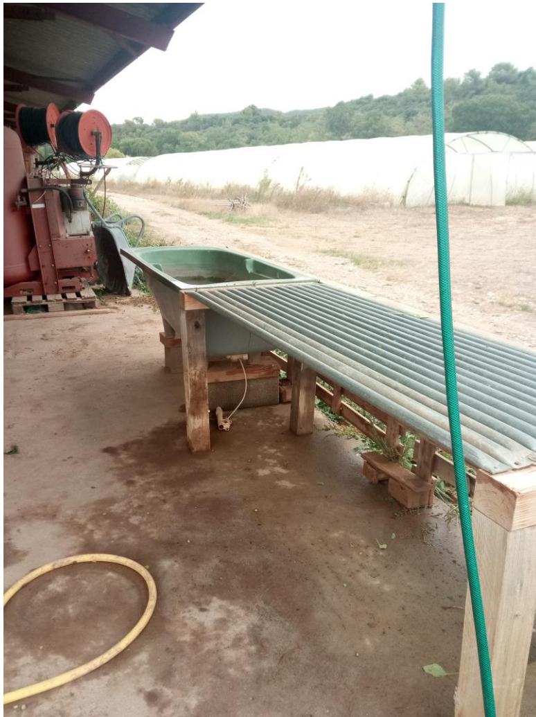
Station de lavage autoconstruite

Agribio- Bertille Gieu, conseillère en maraichage bio Action réalisée avec le soutien financier de :