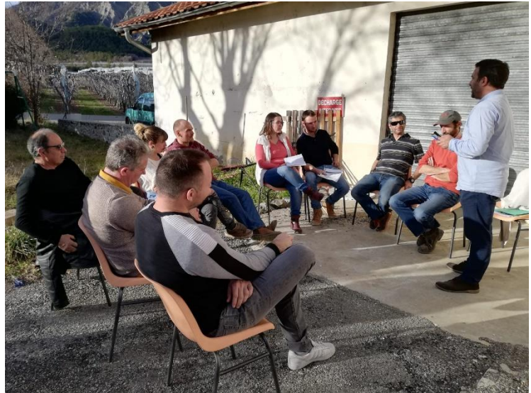
31 janvier 2020- Ateliers d'intelligence collective lors de l'AG de Alpes Coop Fruits

1.7 Réalisation de l'action « se faire connaître » du grand public et de ses confrères arboriculteurs par la création d'un site internet type page « vitrine » : - correction et mise en ligne du site internet en juillet 2020