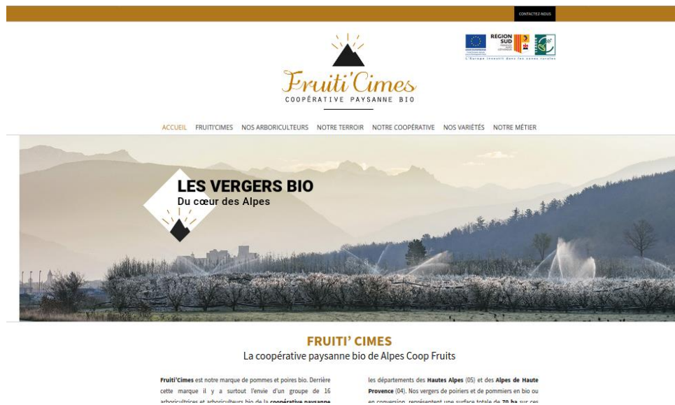
Capture d'écran du site internet créé par les arboriculteurs

1.7 Réalisation de l'action « se faire connaître » du grand public et de ses confrères arboriculteurs par la création d'un site internet type page « vitrine » : - correction et mise en ligne du site internet en juillet 2020