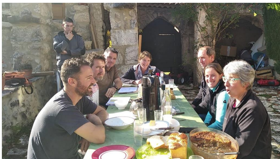
Réunion de lancement du GIEE Agneau Bio à Noyers sur Jabron_12 novembre 2020