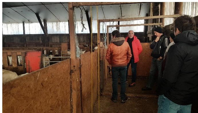
Visite du GAEC du Caïre à Saint Michel de Chaillol_10 décembre 2020