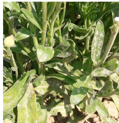
Figure 14 : oïdium sur calendula (25 juillet)

Rédaction : Mégane VECHAMBRE – Agribio04, Victor GALLAND – Agribio05, Sarah PARENT – Chambre d’Agriculture 04