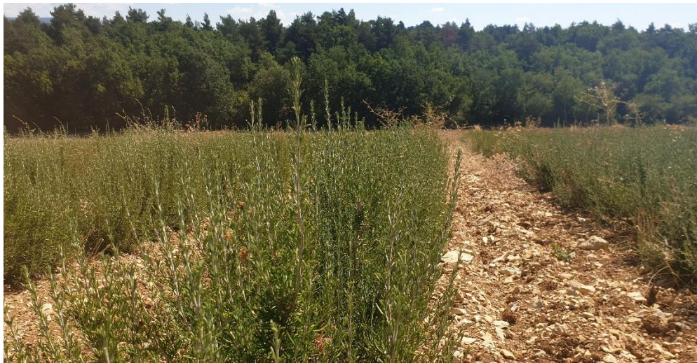
Figure 10 : romarin cinéole (1 ère année) avant la coupe (automne) (9 août)

84 – Albion (secteur Sault) : Romarin (cinéole, 1 ère année) qui est plutôt joli mais qui stagne (il aurait dû faire plus de ramifications), ne sera pas récolté avant que l'on soit sortis de la période de sécheresse.