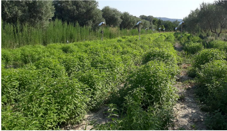
Figure 26 : belle reprise de verveine (25 juillet)