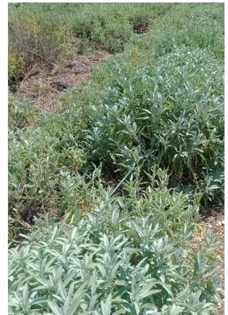
Figure 5 : sauge officinale (3 ème année)

05 – Buëch : La sauge off. petites feuilles (3 ème année) est ici récoltée pour la feuille en herboristerie. Elle n'a pas été récoltée avant floraison, la floraison est passée et elle va être récoltée dans quelques semaines, pour une première coupe (début septembre).