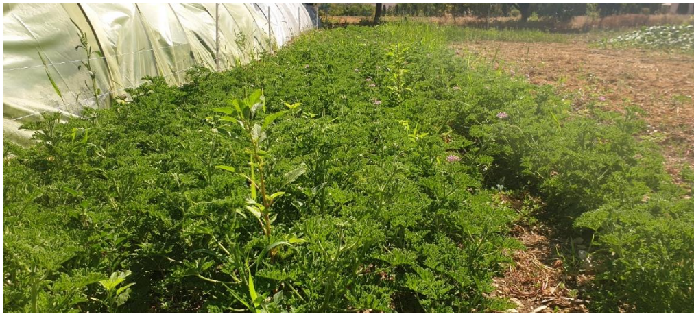
Figure 13 : géranium rosat (2 e année) sous tunnel (en haut) et en plein champ (en bas) (9 août)