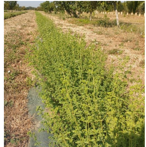
Figure 7 : origan carvacrol dans le secteur Comtat-Venaissin, 2 ème floraison après 1 ère coupe fin mai

84 – Comtat Venaissin : Après une 1 ère récolte fin mai pour la distillation (bon rendement : 1,5 L HE pour 70 mètres linéaires), l'origan carvacrol sur toile tissée arrosé au goutte-à-goutte est (trop) bien reparti, a refait de la feuille et s'apprête à refleurir. Il va être récolté pour la feuille. Attention à ne pas trop « pousser » les plantes avec l'irrigation, même en situation de sécheresse, ce qui risquerait de les épuiser précocement (une irrigation de « survie » est suffisante, quitte à prévoir la 2 nde coupe à l'automne).