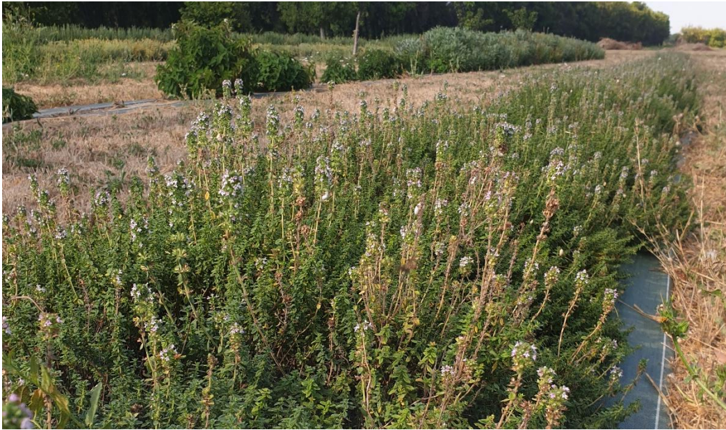
Figure 6 : thym citron coupé fin mai, irrigué au goutte-à-goutte depuis avec une (trop) belle reprise en août (10 août)

84 – Comtat-Venaissin : Très belle reprise des différents thyms (thym citron en photo), mais probablement due à une irrigation (trop) importante au goutte-à-goutte après la coupe. Attention à ne pas trop tirer sur les plantes. Deuxième coupe prévue à l'automne.