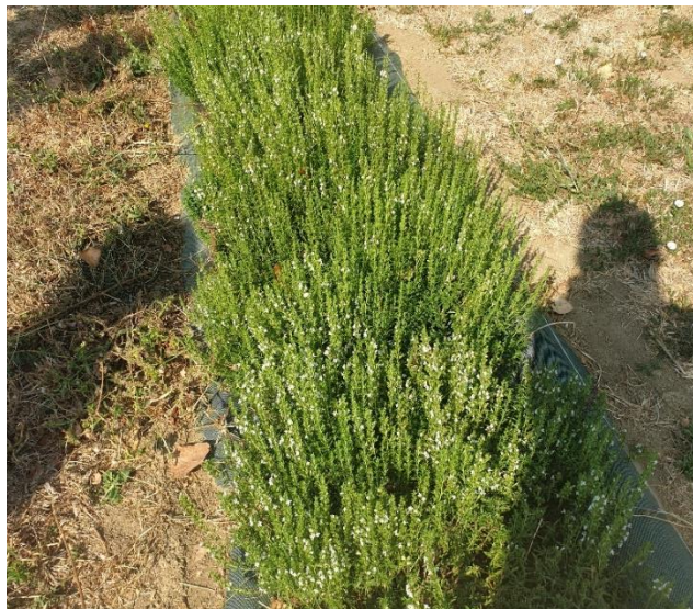
Figure 8 : sarriette dans le secteur Comtat-Venaissin, 2 ème floraison après 1 ère coupe fin mai

84 – Comtat Venaissin : Après une 1 ère récolte fin mai, la sarriette recommence à fleurir. Elle ne sera coupée une seconde fois qu'à l'automne.