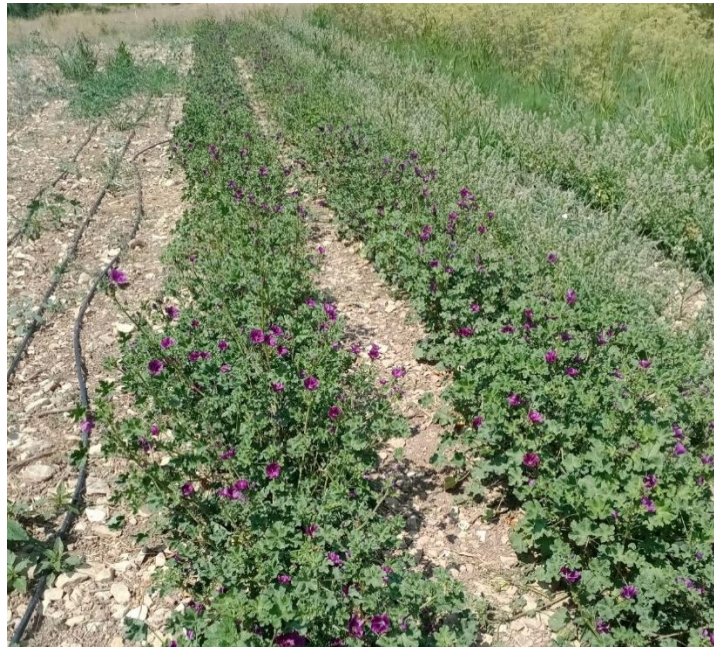
Figure 17 : mauve, début de production significative (11 août)