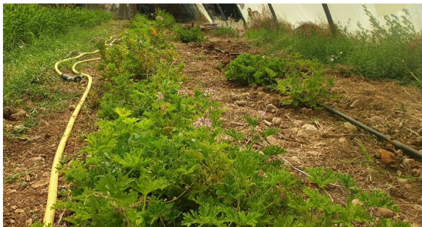
Figure 12 : géranium sous serre, pas encore coupé (10 août)

84 – Comtat-Venaissin : Un géranium rosat (3 ème année) sous serre qui se remet difficilement du gel de l'hiver, et d'un traitement au sulfate de fer mal positionné (+ pression en chiendent, désherbage manuel).