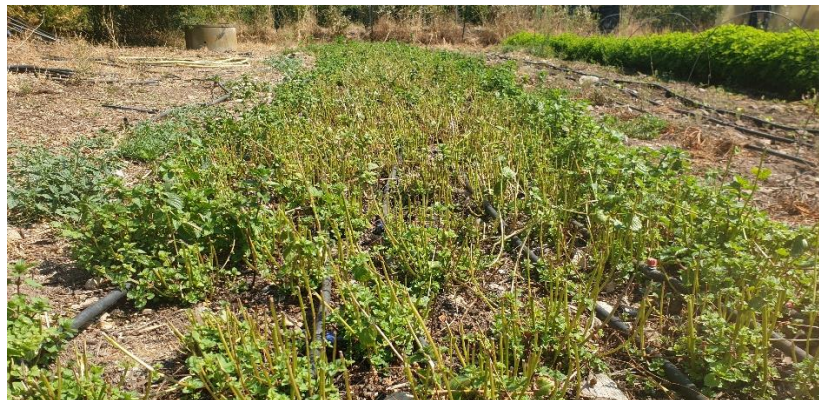
Figure 21 : menthe poivrée coupée début août (10 août)

84 – Comtat-Venaissin (Pernes) : La plantation de l’année a été très belle (rappel : 7 rangs en quinconce (10-12 cm entre plants) avec 6 lignes de goutte-à-goutte). Elle a été coupée pour la 1 ère fois début août, à une hauteur d’un peu plus d’1 m (distillée : environ 10 mL HE pour une planche d’environ 20 m 2 ). L’irrigation a été relancée après la coupe, elle va être désherbée et recevoir un petit apport (manuel) d’engrais organique autour du 20 août.