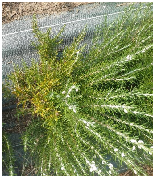
Figure 11 : symptôme d'excès d'eau sur romarin (sudbury blue) (10 août)

Rédaction : Mégane VECHAMBRE – Agribio04, Victor GALLAND – Agribio05, Sarah PARENT – Chambre d'Agriculture 04