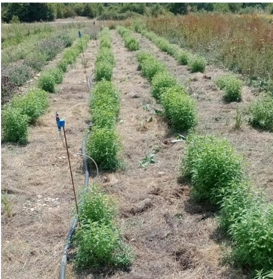
Figure 27 : verveine (2ème année) paillée, avec aspersion (11 août)

05 – Buëch : "Enfin trouvé la méthode sur ce sol pas très favorable". Couverte en hiver avec du P30. Elle est bien répartie en sortie d'hiver malgré un peu de pertes. Paillée en juillet, avec aspersion, avec 2-3cm de paille : 3j après arrosage, le sol n'est toujours pas totalement ressuyé. Pas encore coupée.