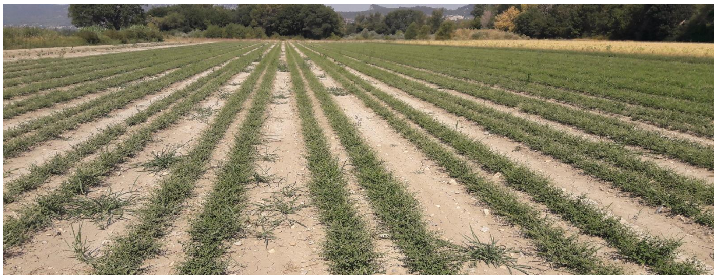
Figure 24 : plantation de l'année de menthe douce (25 juillet)