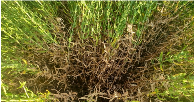
Figure 2 : hysope off var. montana qui sèche au cœur (9 août)

04 – Albion (secteur Banon) : Culture en 3 ème année, hysope officinale var. montana. La source s'est tarie début août chez le producteur, la culture manque particulièrement d'eau et les plants sèchent « de l'intérieur » (photo), jusqu'à la mort de certains plants. Le producteur a arrosé au jet les plants restants.