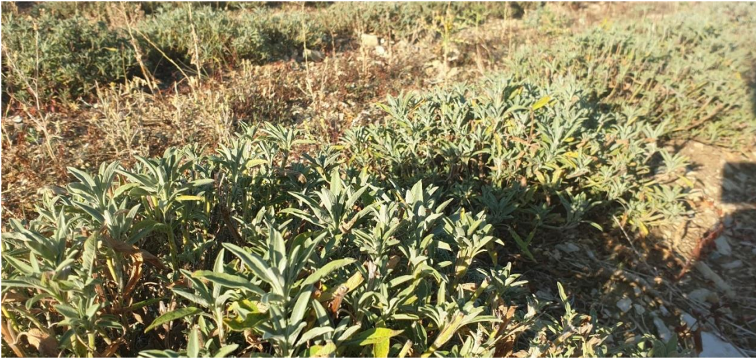
Figure 4 : sauge off. à petites feuilles coupée en juin (9 août)

04 – Albion (secteur Banon) : La sauge off. petites feuilles récoltée mi-juin est, pour le coup, une des cultures qui résiste le mieux aux conditions climatiques actuelles, avec une belle reprise.