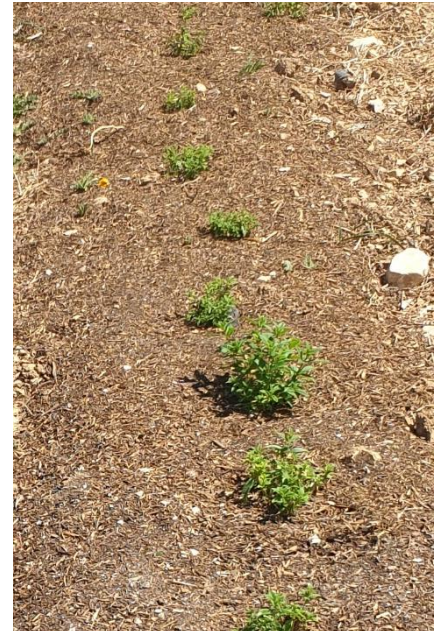
Figure 28 : verveine (1 ère année) sur paillage, coupée fin juillet, pas d'irrigation depuis (9 août)

84 – Albion (plateau) : La verveine plantée de l'année, sur paillage de pailles distillées de genévrier, a été coupée fin juillet (1 ère coupe, herboristerie). Elle n'a pas du tout été irriguée depuis et fait une reprise correcte.