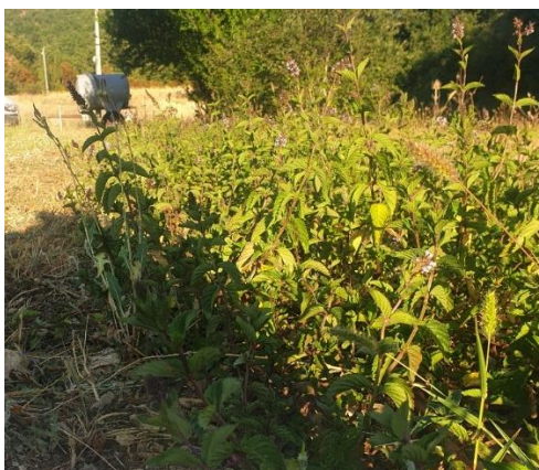
Figure 23 : menthe poivrée de l'année, début de floraison (9 août)

04 – Albion (secteur Banon) : La culture s'est assez peu développée, principalement à cause du manque d'eau, et les plants ne font que 40cm de hauteur. Début de floraison. 1 ère coupe à venir.