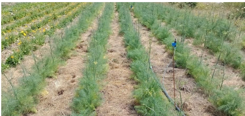
Figure 29 : fenouil 1 ère année sur paillage (11 août)

05 – Buëch : Fenouil graine (plantation de l'année) joli, paillage en juillet avec 2-3 cm de paille (lavande ou céréale).