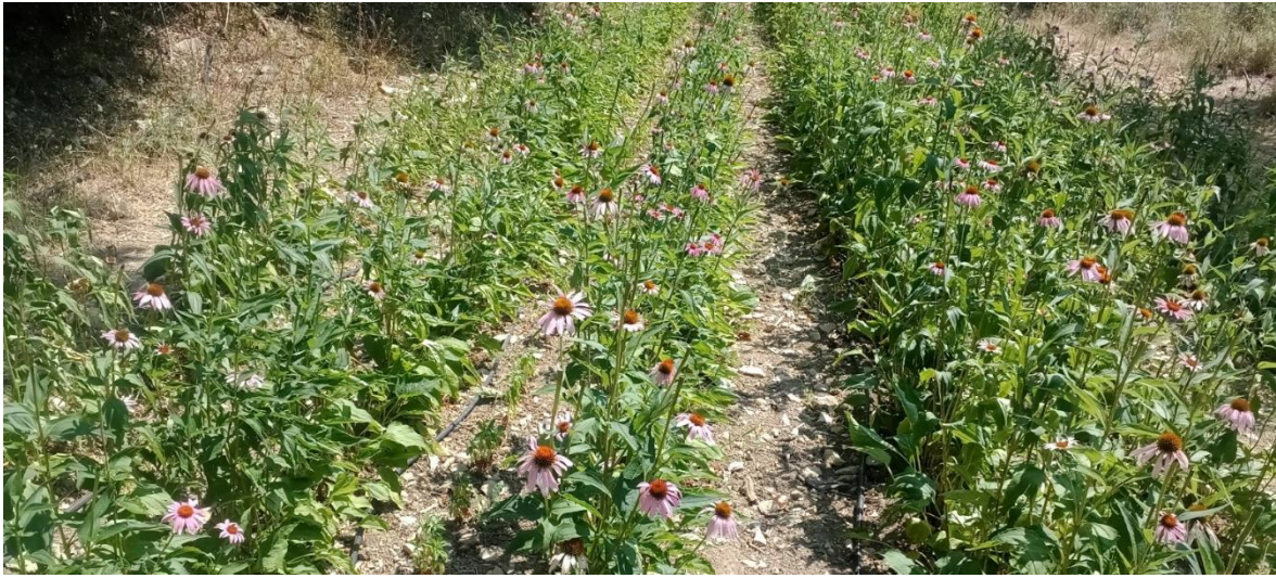
Figure 15 : échinacée en pleine floraison (11 août)