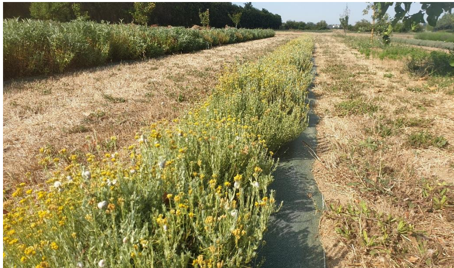
Figure 1 : hélichryse en 2 ème floraison, probablement trop d'irrigation au goutte-à-goutte et coupée trop tôt la 1 ère fois (elle avait stagné longtemps en boutons à cause des fortes chaleurs en mai-juin) (10 août)

84 – Comtat-Venaissin Albion (Pernes) : Cultures en 2 et 3 ème année. Elle a refléuri (irrigation goutte-à-goutte, sur petites surfaces), après une 1 ère coupe pour distillation en juin. Un producteur a refait une coupe le 10 août (macération huileuse).