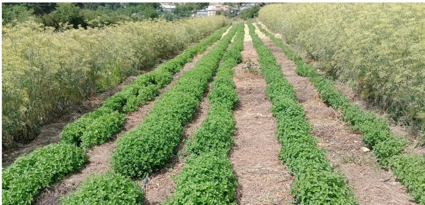
Figure 19 : jolie mélisse avec paillage (ajouté en juillet), 3ème coupe à venir (11 août)