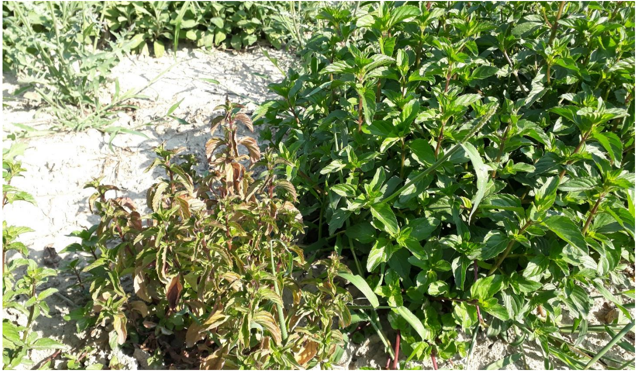
Figure 20 : symptôme inconnu sur menthe poivrée (25 juillet)

84 – Comtat-Venaissin (Pernes) : La plantation de l’année a été très belle (rappel : 7 rangs en quinconce (10-12 cm entre plants) avec 6 lignes de goutte-à-goutte). Elle a été coupée pour la 1 ère fois début août, à une hauteur d’un peu plus d’1 m (distillée : environ 10 mL HE pour une planche d’environ 20 m 2 ). L’irrigation a été relancée après la coupe, elle va être désherbée et recevoir un petit apport (manuel) d’engrais organique autour du 20 août.