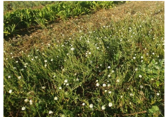
Figure 16 : camomille romaine en fin de course (9 août)

84 – Albion : La camomille se maintient malgré le climat, les fleurs ont récoltées manuellement depuis juin, mais la dernière coupe (sommité fleurie) pour la distillation ne se fera peut-être pas compte-tenu de l'état de la culture aujourd'hui.