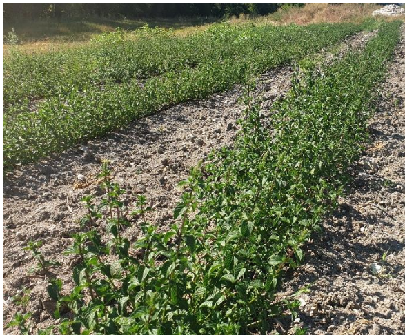
Figure 22 : menthe poivrée plantée de l'année, sur sol lourd, tout début de floraison (9 août)

84 – Albion (secteur Sault) : Les plantations de l'année sont plutôt belles. Elles le sont d'autant plus sur une parcelle dont le sol est assez léger, que sur la parcelle dont le sol est particulièrement argileux et lourd (ce qui semble limiter le développement des rhizomes en sous-sol). Pas encore coupée mi-août.