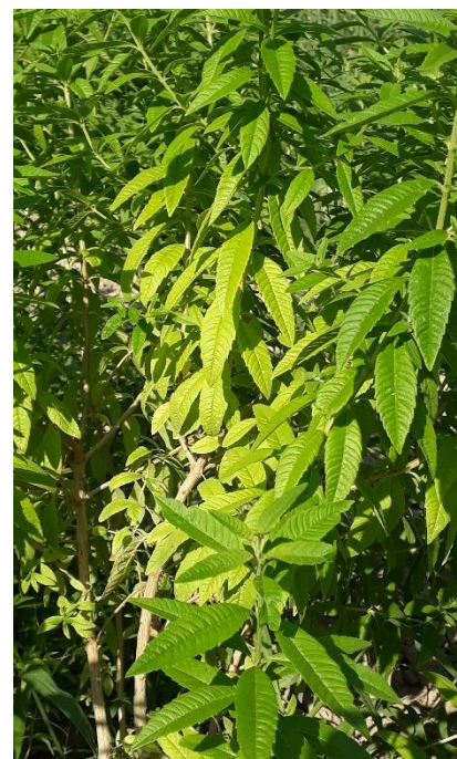
Figure 25 : jaunissement (par le bas) des feuilles sur verveine (25 juillet)

04 – Val de l'Asse / Val de Durance (sol limoneux) : Verveine de 2 ème année : Bonne reprise suite à la 1 ère coupe. Désherbage en cours. Absence de ravageurs et/ou maladies. Contrairement à la 1 ère , l'AMV a quasiment disparu, quelques plants ont quelques symptômes. Cependant, comme l'irrigation est limitée, apparition de symptômes de sécheresse (ensemble des feuilles du bas deviennent vert clair puis jaunissent), ou bien de carence azotée.