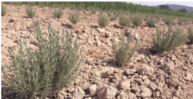
Figure 9 : plantation de l'année de romarin (25 juillet)

04 – Val de l'Asse / Val de Durance : Toujours un bon développement des plants de l'année, absence de maladies ou ravageurs. Toujours très hétérogène pour les autres parcelles ; mortalité ou plants jaunissant, devraient être récoltés très rapidement (août).