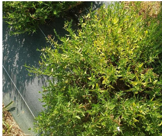
Figure 3 : possible chlorose ferrique sur hysope (10 août)

84 – Comtat Venaissin (Pernes) : Toujours des symptômes de jaunissement des feuilles : probablement chlorose ferrique -> il faut prévoir un traitement aux chélates de fer à l'automne (à partir de septembre), quand les conditions seront un peu moins sèches.