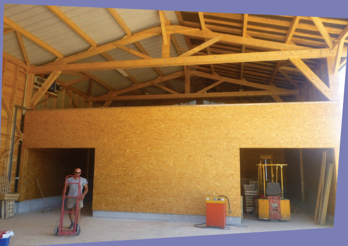
CHAMBRES FROIDES NORD ET SUD - LE JARDIN DE JULIEN

L'une des chambres est orientée sud pour le stockage des légumes l'hiver (ex : courge) et l'autre au nord pour les légumes se conservant à plus basse température.