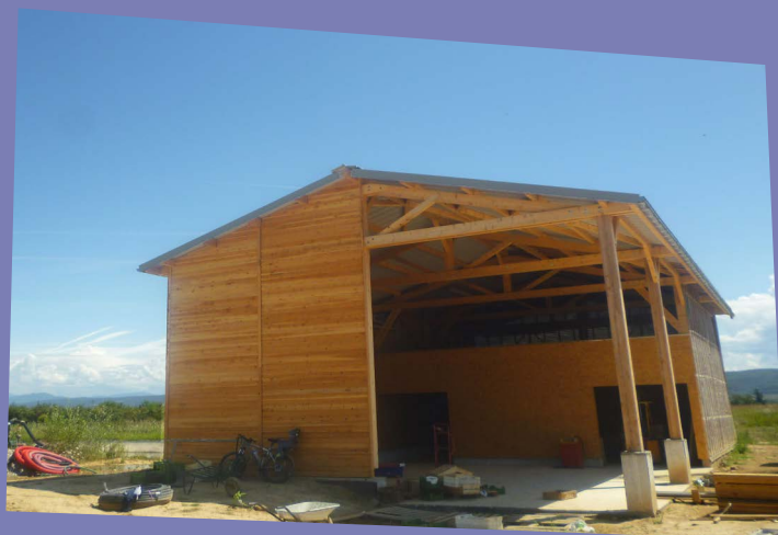
VUE D'ENSEMBLE DU HANGAR DE STOCKAGE - LE JARDIN DE JULIEN

La mise en place d'un puit canadien est prévue pour la chambre positive (tube enterré sur 85 m de long entre 1m20 et 1m70 de profondeur), ce qui permettra le maintien d'une température de 12°C, pour le stockage des légumes, le tout sans consommation d'énergie.