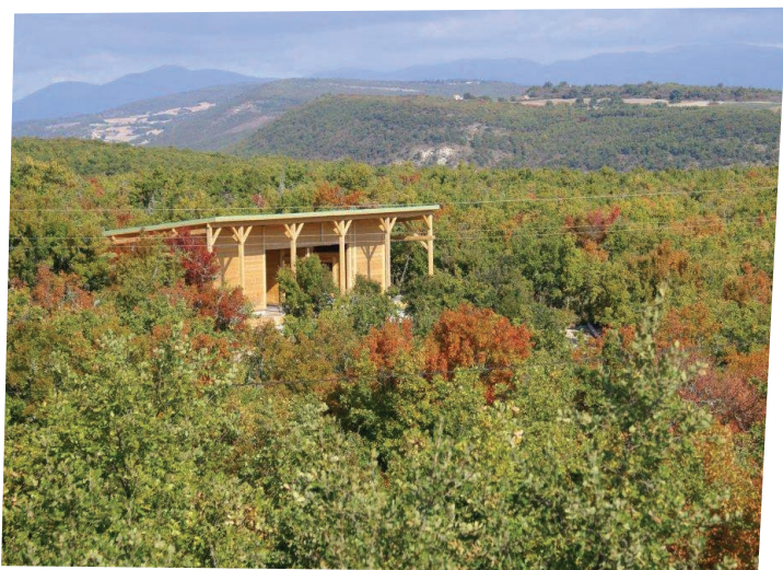
VUE D'ENSEMBLE DE LA MIELLERIE S'INTÉGRANT AU PAYSAGE - LE JAS DES ABEILLES