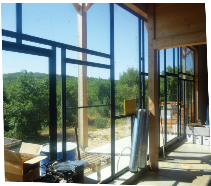
FAÇADE DOUBLE VITRAGE DE LA MIELLERIE - LE JAS DES ABEILLES