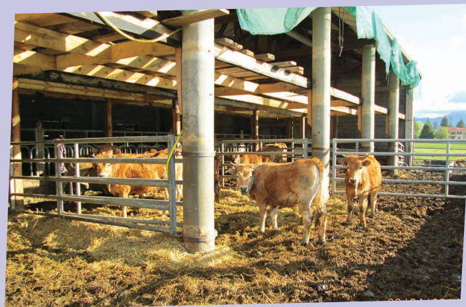
ÉLEVAGE VACHE RACE AUBRAC - GAEC DE MAGALON

Le fumier est pailleux sur stabulation libre d'octobre à mai (le reste de l'année, le bétail est conduit en grande partie en pâturage en montagne). Le compostage est conduit en andain d'une hauteur de 2-3m, avec un premier retournement après 3 semaines et un deuxième retournement 2 mois après le premier. Les retournements sont assurés à l'aide d'un chargeur. Le compost jeune et riche en azote est laissé en maturation avant son utilisation, généralement en début d'hiver et lorsque le sol est sec.