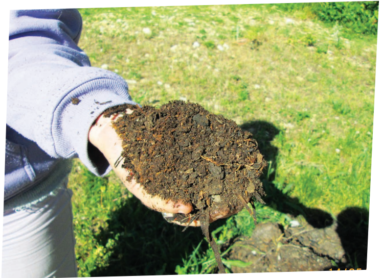
COMPOST - DOMAINE D'ARAGON