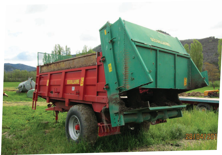
ÉPANDEUR DE FUMIER -GAEC DE MAGALON

Un compost mûr plus dégradé constituera une matière stable pour entretenir l'humus du sol, plus adaptée aux sols à texture grossière.