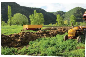
COMPOSTAGE DU FUMIER - GAEC DE MAGALON