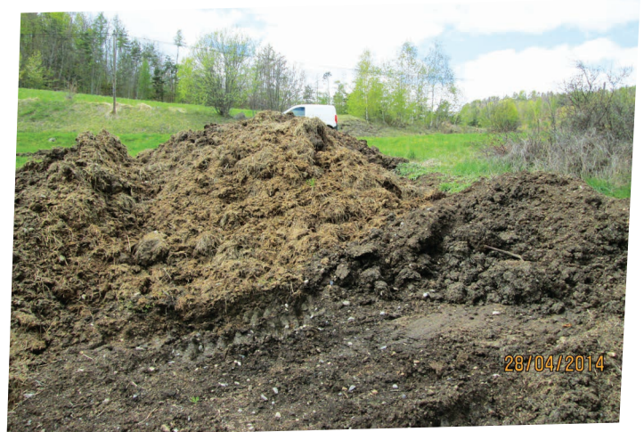
COMPOSTAGE CHEZ E. AUVE À LA BRÉOLE.