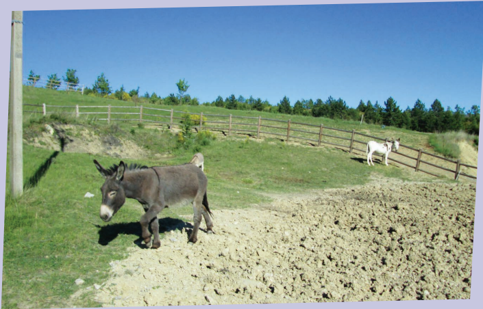
SITE DU COMPOSTAGE - DOMAINE D'ARAGON