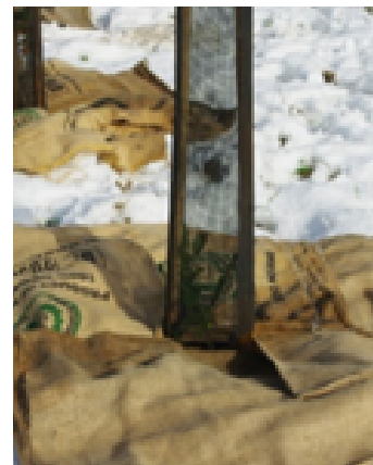
Manchon de protection contre le gibier