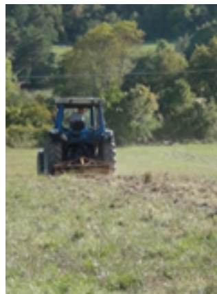
passage du Ripper