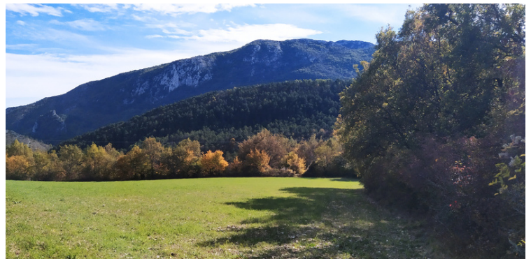
Haie composite. Sallagriffon

Ex : 300 à 1500 € le m3 de bois frais sur pied, pour le noyer ou le cormier.