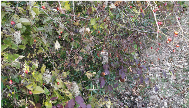
Haie composée, entre-autre, d'églantiers, d'arbres à perruque, de cornouillers, de noisetiers... Sallagriffon, crédit photo : Agribio 06.

Précieuse alliée de l'agriculture biologique, ses intérêts sont multiples, que ce soit en maraîchage, en arboriculture ou pour tout(es) autre(s) production(s) :