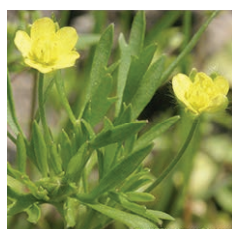
La renoncule des champs